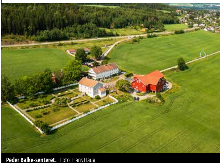
Peder Balke-senteret.