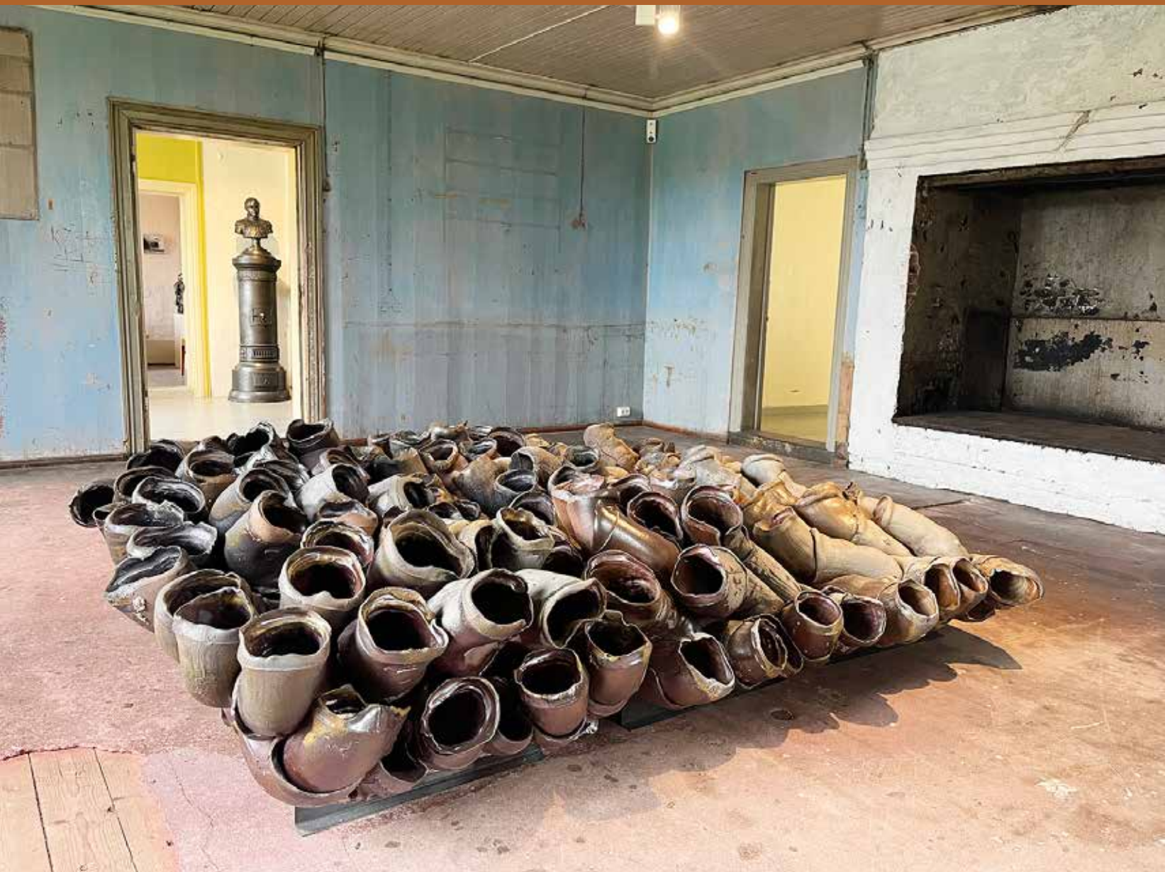
Den største av installasjonane til Torbjørn Kvasbø er plassert på det gamle kjøkkenet i første etasje.

Torbjørn Kvasbø i Aftenpostens K-magasinet i 2012