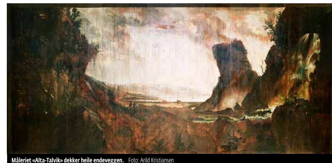
Måleriet «Alta-Talviko» dekkjer heile endeveggen.