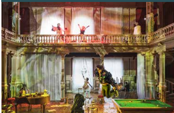
Måten den 140 år gamle Logen er utnyttet på, fortener eit stort pluss, skriv Jan H. Landro.