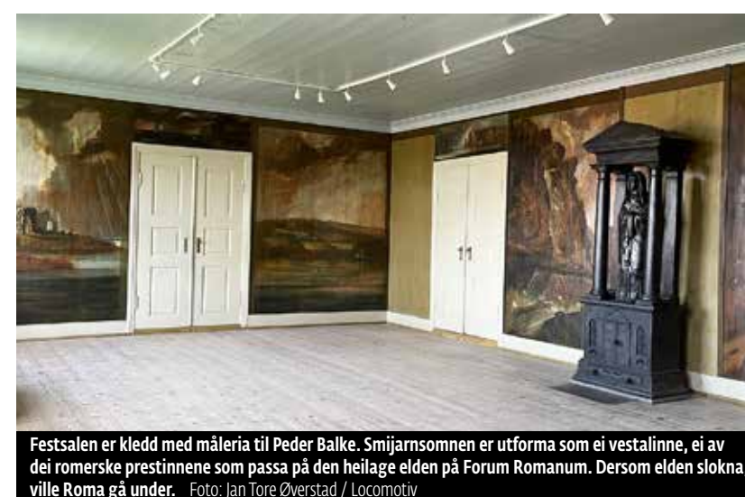
Festsalen er kleidd med måleria til Peder Balke. Smijarnsommen er utforma som ei vestalinne, ei av dei romerske prestinnene som passa på den heilage elden på Forum Romanum. Dersom elden slokna, ville Roma gå under.